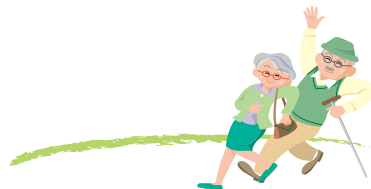
日本民家園の見学