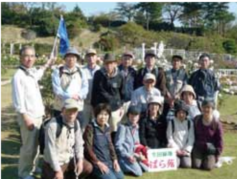
ぼら苑で集合写真