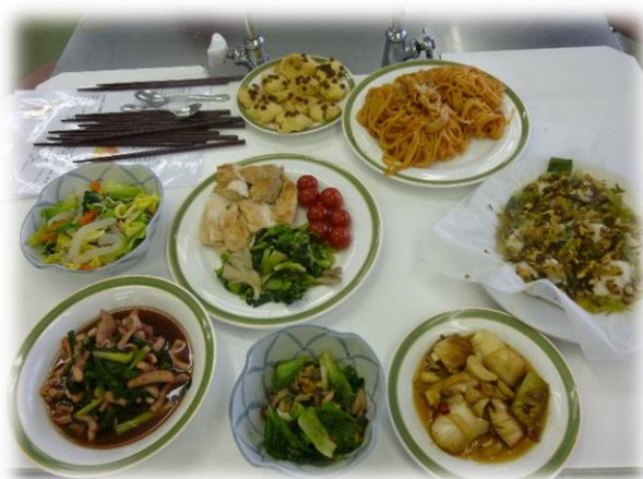
【昨年実習で作った料理】