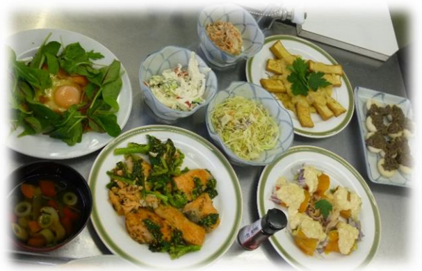
【昨年実習で作った料理】