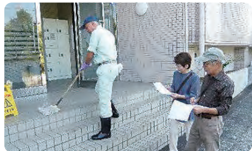
安全・適正就業巡回指導の様子

就業現場の巡回として、麻生区内にあるマンション清掃現場を巡回指導しました。4階建てマンションの廊下や階段等の共有部分を1名の会員が清掃作業を行っており、安全に作業を行うため、居住者の通路確保や道具の整理整頓を行いました。また、階段部分などの危険箇所では滑って転倒しないよう足元の安全確保に努めるなど、安全に配慮した就業が確認できました。引き続き安全作業をお願いします。