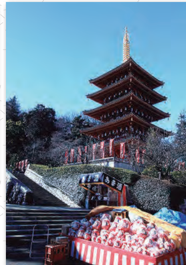
「高幡不動」