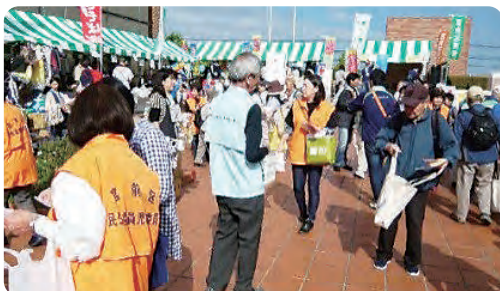
宮前区民祭PR活動の様子