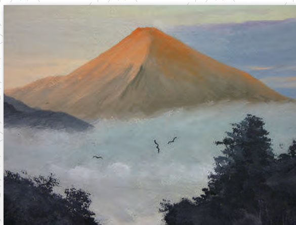
「幻想な富士」名内 国雄 会員 (油絵)