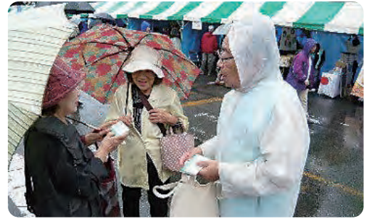
あさお区民まつり PR活動の様子

当日は、あいにく朝から雨が降り、実施出来るか心配されましたが、会員・職員で協力し合いセンター広告入りのポケットティッシュを配布し、多くの来場者にセンターのPRをすることが出来ました。参加して頂いた会員の皆様、ご協力ありがとうございました。