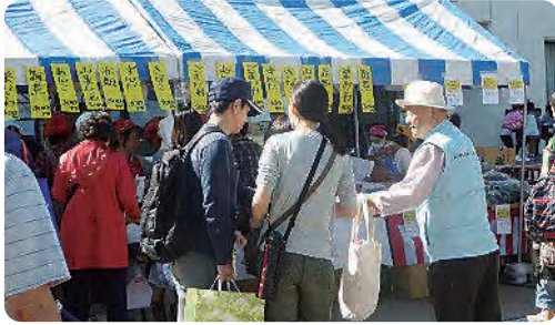
幸区民祭PR活動の様子