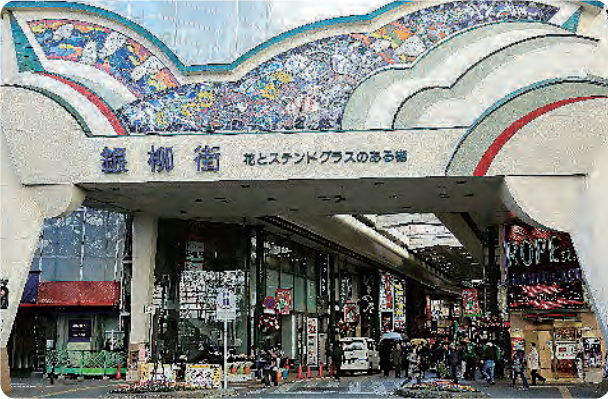
人々の心と商店街を繋ぐ架け橋として建設されたアーケード

銀柳街とは、川崎駅東口のメイン通りである新川通りと市役所通りの間を結んだ約200メートルの川崎を代表する駅前商店街で、そこにある各店舗は川崎銀柳街商業協同組合（現在51店舗で構成）に加え、商店街の発展と売り上げ増進を図っているそうです。 現アーケードは川崎のイメージアップと商店街の永続的な発展を