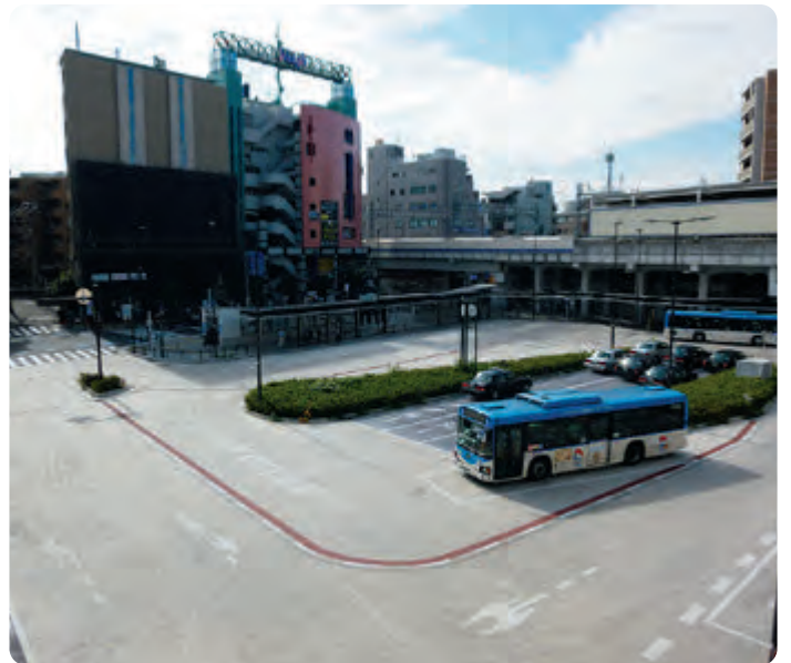
溝口駅南口バス乗り場