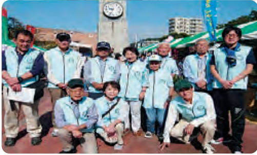
あさお区民まつりPR活動の様子