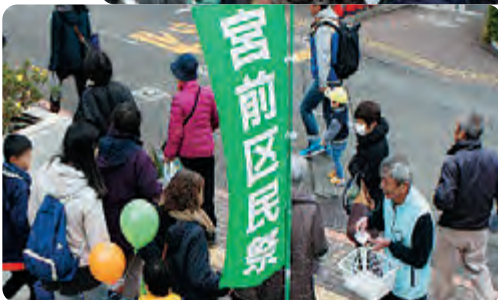
宮前区民祭のPR活動の様子