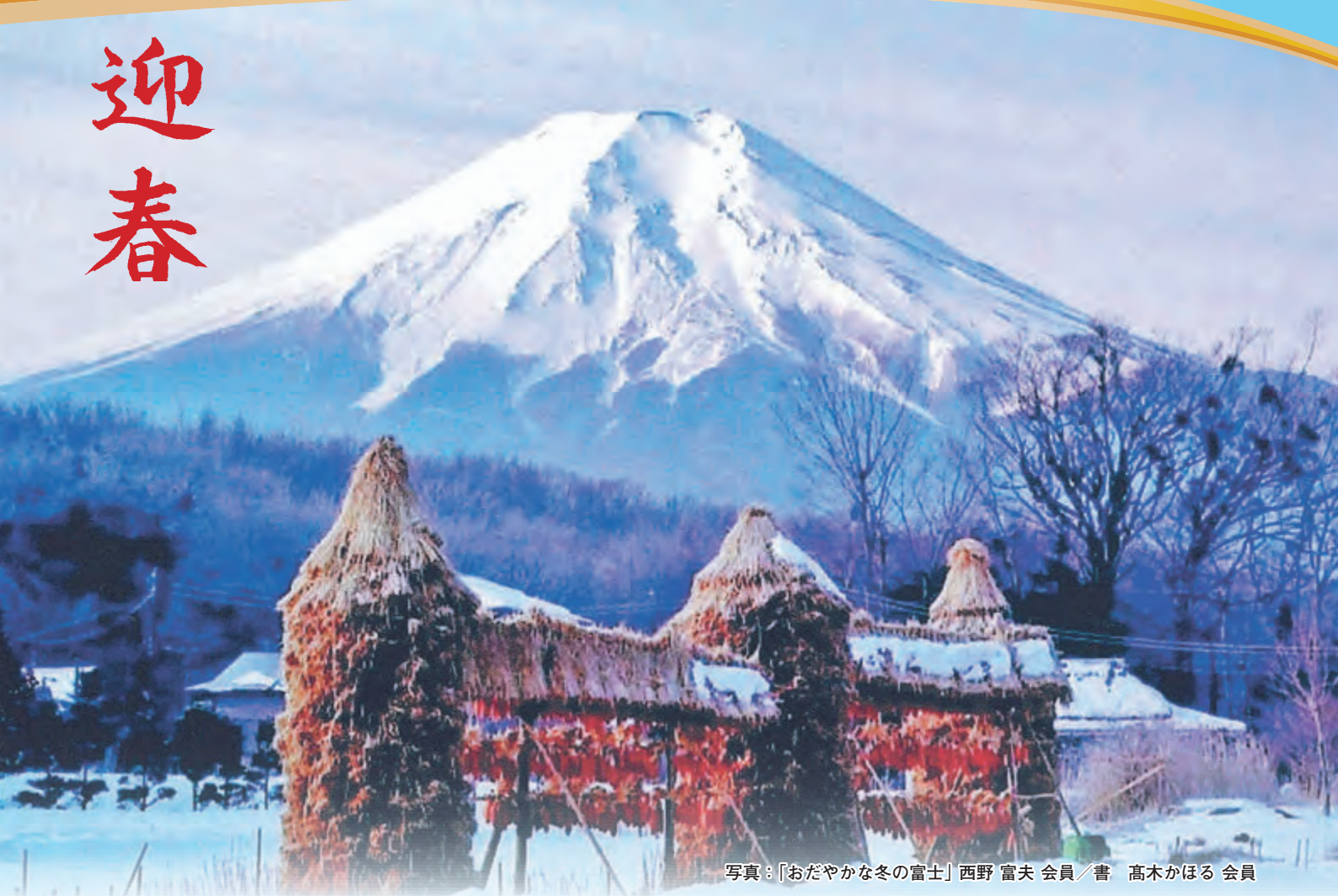
写真：「おだやかな冬の富士」西野 富夫 会員／書 高木かほる 会員