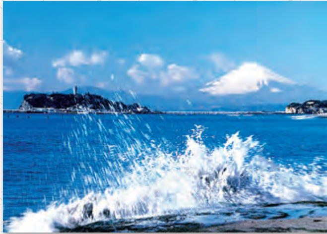
「江の島と富士」高野 裕昭 会員