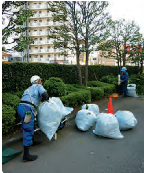
安全適正就業 (剪定作業中)

会員4名で剪定作業を行っている現場を巡回しました。ちょうど剪定した枝葉を袋詰め、指定の場所に移動させているところでした。剪定作業に適した装備をし、道具等も置き場を決めきちんと整理されていました。また、現場が広いためお互いに声を掛け合い、安全就業を意識して作業を行っていることが確認できました。