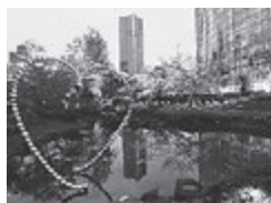
令和6年1月号表紙作品