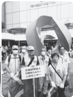
南部事務所 (JR川崎駅周辺)

※北部事務所が参加する予定でした新百合ヶ丘駅前の活動は荒天のため中止となりました。