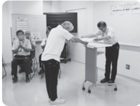
「安全就業標語」最優秀表彰式