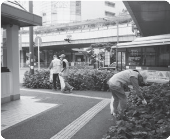
中部事務所 (溝ノ口駅周辺)

今年も当センターの地域へのPRと、社会奉仕活動の一環として、市内統一美化活動に参加しました。活動場所であるJR武蔵溝ノ口駅北口の「ペDESTリアンデッキ」周辺は、落ちているごみも少なく見えました。路上や植え込みの中には煙草・ペットボトル・空き缶等のごみが落ちており、美化活動参加者がそれらを丁寧に拾い集め綺麗にしています。ご参加いただいた会員の皆様、ご協力いただきありがとうございます。