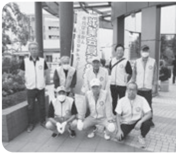
中部事務所 (JR武蔵溝ノ口駅周辺)