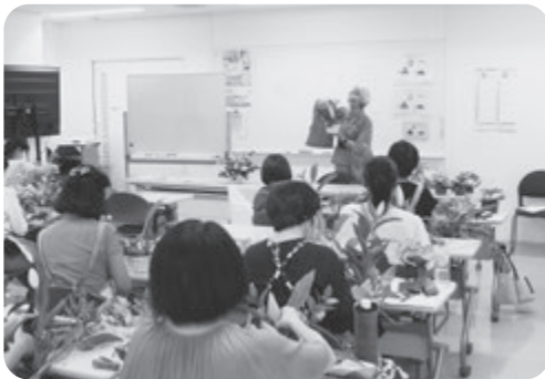
養成講習会の様子

また、受講者同士で仲良くお喋りしながら楽しそうにしている姿が印象的でした。受講者の皆様本当にお疲れ様でした。