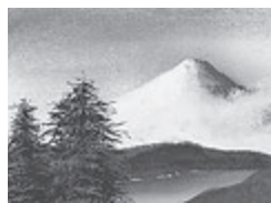
令和5年1月号表紙作品