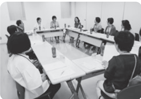
コーディネーター合同会議の様子

家事援助は昨年に引き続き高齢者世帯や、親族の方、地域包括支援センターからの依頼が増えています。また、若い世帯では在宅ワークが多く、清掃から洗濯、調理と多種多様で、調理は大量の作り置き依頼が増加し、会員としては大変な作業となっています。その一方で、子育て支援は今まで依頼が多かった送迎業務は減少傾向となつていますが、今後もお客様の様々なニーズに対して、コーディネーターと各事務所の担当者で連携を取って対応していきたいと考えています。