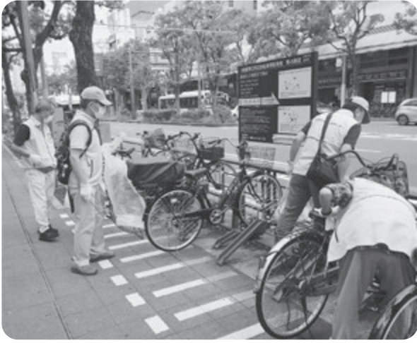
南部事務所 (川崎駅周辺)

とてもきれいになりましたね。でも、まだマナーを守らない方々も一部いらっしゃるの、このように大勢のボランティアが街をきれいにしている姿を見てもらうことで理解が得られれば。」とのご意見がありました。