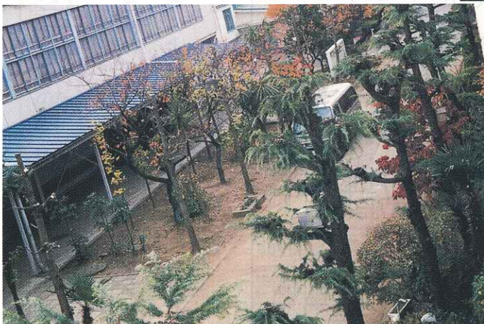
剪定後の樹木 (すっきり、さっぱり)

ために講師の話術を随所に取り入れ、笑顔の講習会風景も見受けられました。 今後もこれらの講習会を継続してまいります、これ以外に会員さんが主体となった会員による会員のための講習会を検討してまいりますので、ご意見ご協力をお願いいたします。