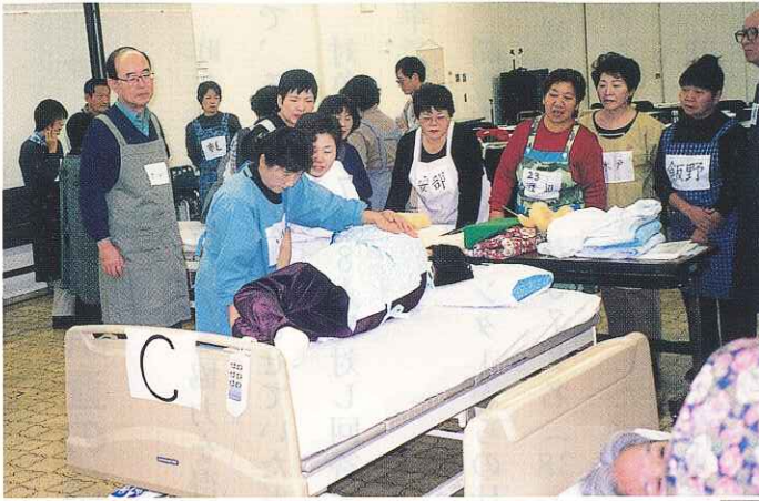
介護実習風景 (真剣な顔、顔…)

各講習会とも定員をオーバーしたため抽選にて決定しました。応募者の多くは手に職をもとう身につけよう、そして社会貢献に役立てようと言う方々も多く講習会によせる関心の深さがかがわれました。 また講師からは、この経験を一つのステップとして、