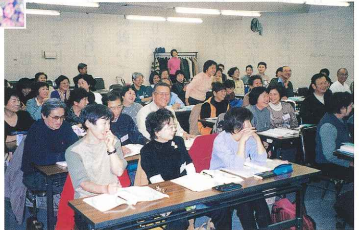
講義中 (笑顔もでた講習会)

各講習会とも定員をオーバーしたため抽選にて決定しました。応募者の多くは手に職をもとう身につけよう、そして社会貢献に役立てようと言う方々も多く講習会によせる関心の深さがかがわれました。 また講師からは、この経験を一つのステップとして、