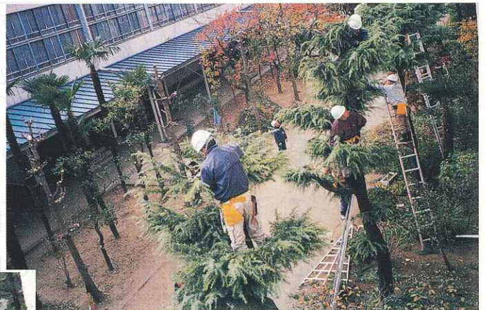
実技実習 剪定作業中