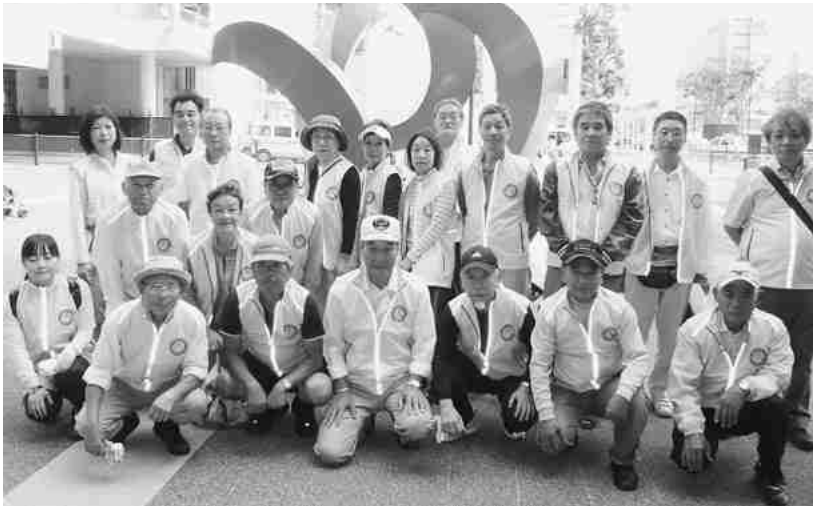
普及啓発活動を兼ねた市内統一美化活動への参加（9月）

シルバー人材センターの事業理念を広く市民のみなさんに理解していただくために、全国シルバー人材センター事業協会は、毎年10月を「シルバー人材センター事業啓発促進月間」と定め、全国で「普及啓発促進キャンペーン」が行われます。当センターでも、本事業についての啓発・増進及び事業の拡大を図るため会員・役員と一体となった啓発活動を積極的に推進します。