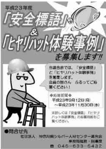
「安全就業標語」及び「ヒヤリハット体験事例」募集ポスター

神奈川県シルバー人材センター連合会では「安全就業標語」及び「ヒヤリハット体験事例」の募集を行っております。応募用紙は各事務所に用意しておりますので、奮ってご応募下さい。