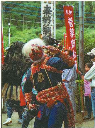
「菅の獅子舞」

お気軽にご相談ください。 なお、相談窓口の「相談日と相談時間」は次のとおりです。