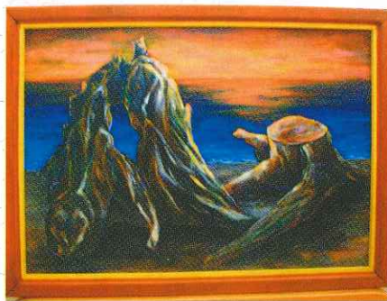
油絵『夕日を浴びる流木』 菅原 恭孝 会員 作