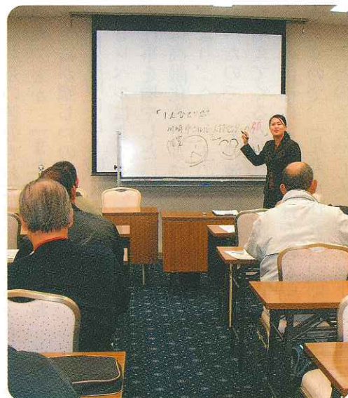
交通安全講習会・接遇研修風景

対象に、十一月二十七日に「エポックなかはら」において開催。今回は、交通安全講習会と接遇研修を組み合わせて、午前と午後の二つのグループに別けて実施し、延べ三十五名の会員が受講しました。