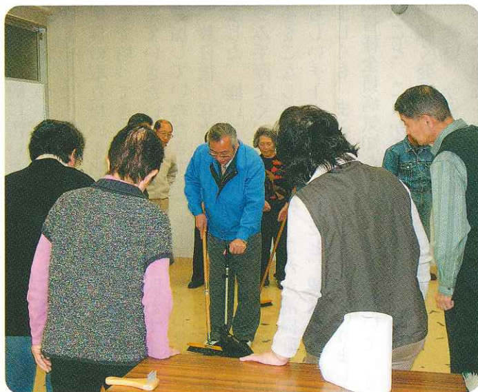
ハウスクリーニング講習会風景

午前は、玄関・階段・廊下などの掃除の仕方と雑巾や箒の使い方の実習、午後は、トイレやカーペットの掃除の仕方とモップや掃除機の使い方などを実習しました。最後に作業中の安全確保に関する注意事項もあり、プロの技と豊富な知識に感心させられました。講習会終了後は、皆さん掃除の達人になった気分になられたようで、年末の自宅の掃除に早速応用できると張り切っていました。