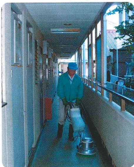
公共集合住宅の定期清掃風景