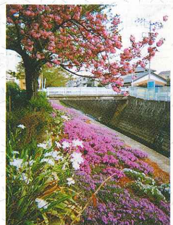
『癒しのほとり』