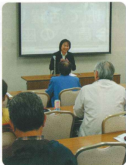
子育て支援講習会風景

市立保育園と消防署の職員の方を講師に迎え、こどもが発症しやすい病気と対応、こどもの発達と遊び、怪我と安全等について、映像を交えた分かり易いお話や、実物大の人形をモデルに心肺蘇生法の実演もあって、受講者から「大変参考になりました」という声が多く寄せられました。