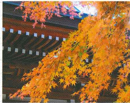
『王禅寺の紅葉』