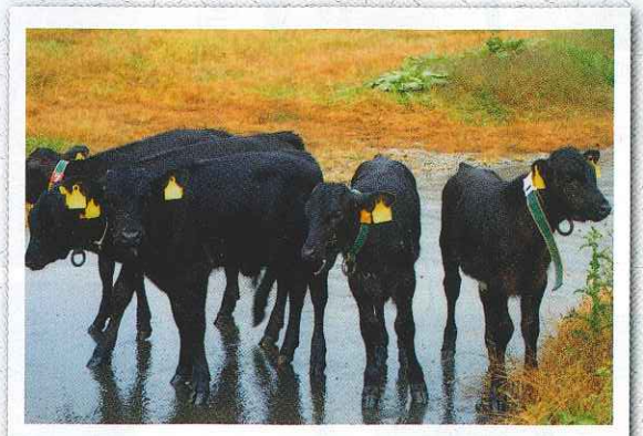
『牛』 今年の干支である牛を栃木県那須塩原で撮影しました。