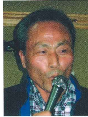
「北国の春」を皮切りに自慢のノドを披露

「いい忘年会だった」「食べ物も飲み物もふんだんで、満腹」「食べきれない料理の土産パックが良かった」(会員の声)。