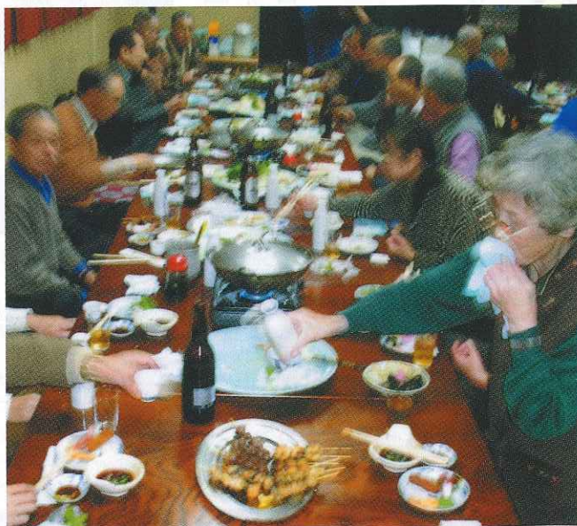
料理の数々がテーブルを飾る。ビール、お酒、焼酎のみ放題

箱に「3角クジ」が人数分入っている。金銀銅が各1品でオリンピックもどきのランク付け。