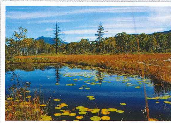
『尾 瀬』 村岡 栄進 会員 撮影 9月に尾瀬の自然園にある沼を撮影しました。沼に羊草が浮いていて綺麗でした。