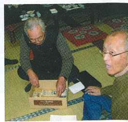
集金、照合で会計係は大忙し