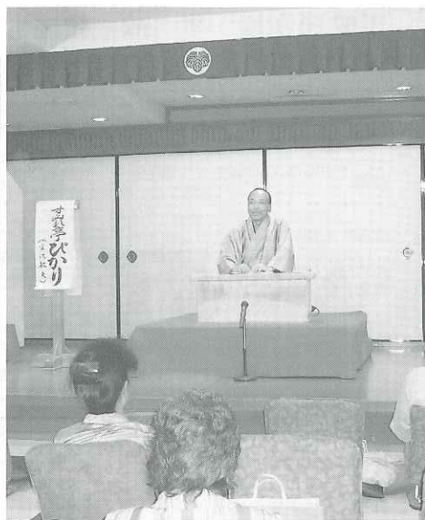
有名な「鼓が滝」を熱弁中